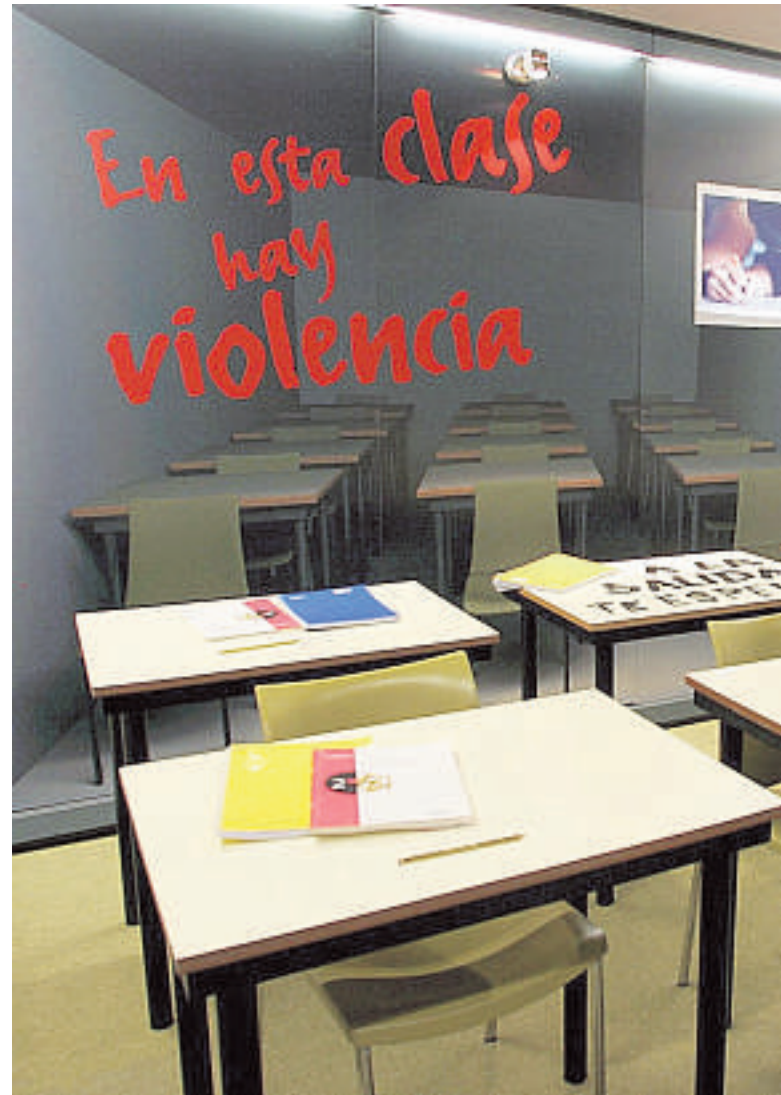
Aspecto de una exposición que recrea la violencia en las aulas

«Solamente pensar que tengo clase con 4º de ESO B se me pone un nudo en el estómago», confiesa un profesor de Matemáticas, al que los alumnos le impiden trabajar y no le obedecen. Y para colmo de su desencanto y humi-